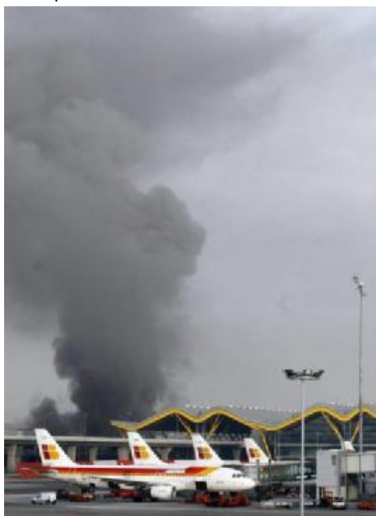
Bombo di E.T.A. ocidas du personi ye decembro. Tale finis periodo de tri yari sen mortinti e la espero pri la posibla fino di la terorismo en Hispania.

La organizuro IRA abandonis la armi ante atingar lua skopo, mem ante konquestar por la Norda Irlando ulo simila kam la autonomeso qua havas la Hispana regiono Baska dum la lasta du yardeki.