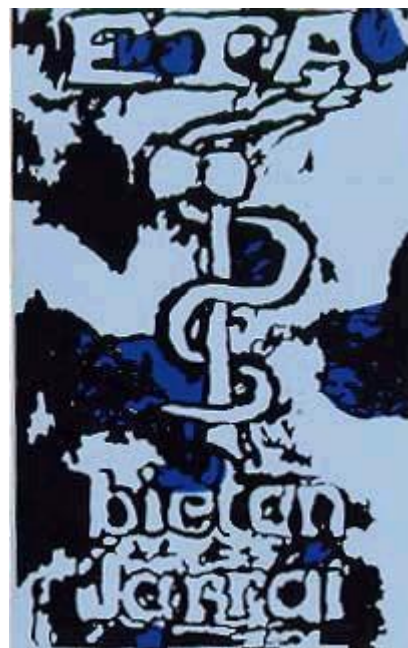
Simbolo di la organizuro terorista E.T.A. (Euskadi Ta Askatasuna, Ide: Baska patrio e libereso)

Otegi revas pri la posibleso ke lo anke povus eventar pri lu ipsa. Altra revo di Otegi, segun lu ipsa deklaris koram quaradek membri di Sinn Fein en "pub" di Belfast, esas ke ye ula futura dio "Euskal Herria" (la nuna regiono Baska en Hispania, Navara e regiono Baska en sud-Francia) esez sendependa lando Europana kun ambasaderio en Dublin". Kurioze la tradukisto, membro di Sinn Fein, tradukis a la Angla la frato da Otegi ma dicit pluse "od en Belfast". Ta spontana reakto di la tradukisto savigas ke la ipsa Sinn Fein-ani koncias ke la dio ye qua Irlando riunionigesos ne esas proxima.